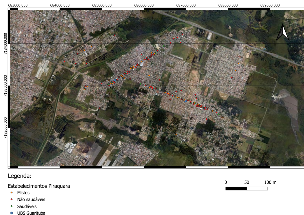
Figura 1. Mapa estabelecimentos Piraquara