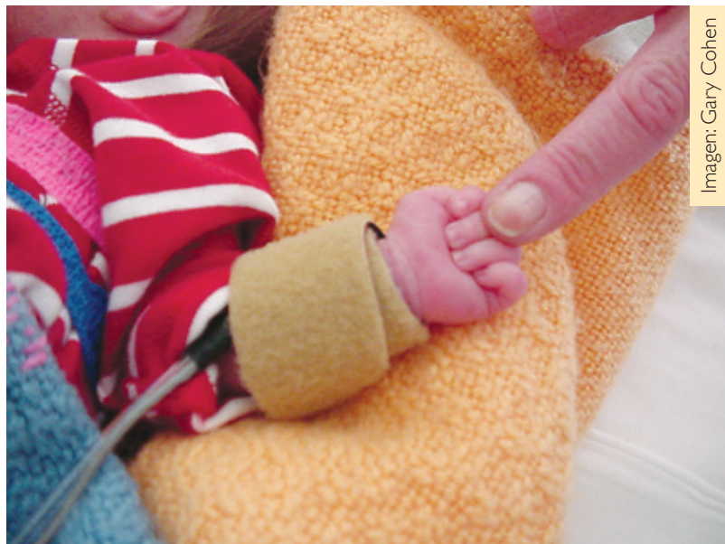
Imagen: Gary Cohen

Los bebés expuestos mostraron una tendencia similar con el tiempo. Sin embargo, entre los 3 meses y el año de edad, sus respuestas se volvieron exageradas, con un ritmo cardiaco más acelerado (con un