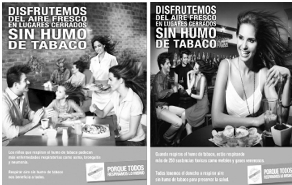
FIGURA 1. CARTELES DE LA CAMPAÑA