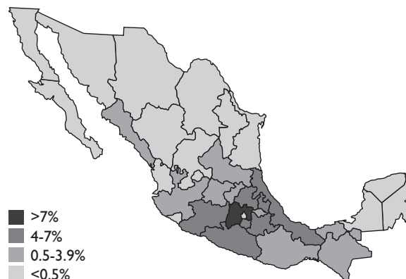
FIGURA 1. PORCENTAJE DE PACIENTES ATENDIDOS EN LOS INSTITUTOS NACIONALES DE SALUD, SEGÚN ENTIDAD DE RESIDENCIA. MÉXICO, 2010

Dentro de las principales entidades declaradas como de residencia habitual por este tipo de pacientes destaca el Estado de México: en los Sesa casi uno de cada tres pacientes foráneos son mexiquenses; en los INS este porcentaje asciende a 53%, y en los HFR a poco más de 80%. Resulta importante mencionar que si bien en los INS y los HFR se documentó la atención de pacientes foráneos provenientes de todo el país, los porcentajes muestran marcadas diferencias según la cercanía con el Distrito Federal (figura 1). En los HRAE las principales entidades declaradas como de residencia (Quintana Roo, Michoacán y Zacatecas) obedecen claramente a una dinámica geográfica, ya que los hospitales que conforman esta categoría se encuentran localizados en Oaxaca, Yucatán y Guanajuato.