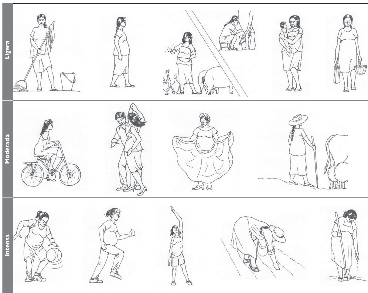
FIGURA I. REPRESENTACIÓN DE DIFERENTES NIVELES DE INTENSIDAD DE ACTIVIDAD FÍSICA PARA FACILITAR SU IDENTIFICACIÓN Y PRÁCTICAS DURANTE EL EMBARAZO Y POSPARTO ENTRE BENEFICIARIAS DEL ESTADO DE PUEBLA, MÉXICO, PROGRAMA OPORTUNIDADES - ESIAN, 2009

como: a) Sí comentó a detalle; b) Sí comentó algo, o c) No se comentó (cuadro II).